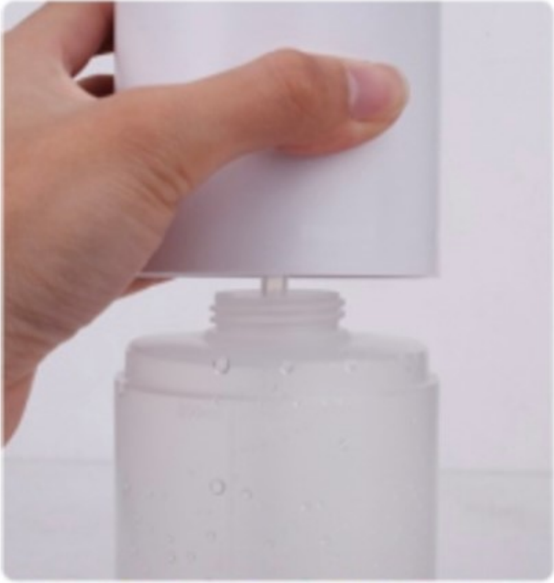
図3：本体とボトルをセット