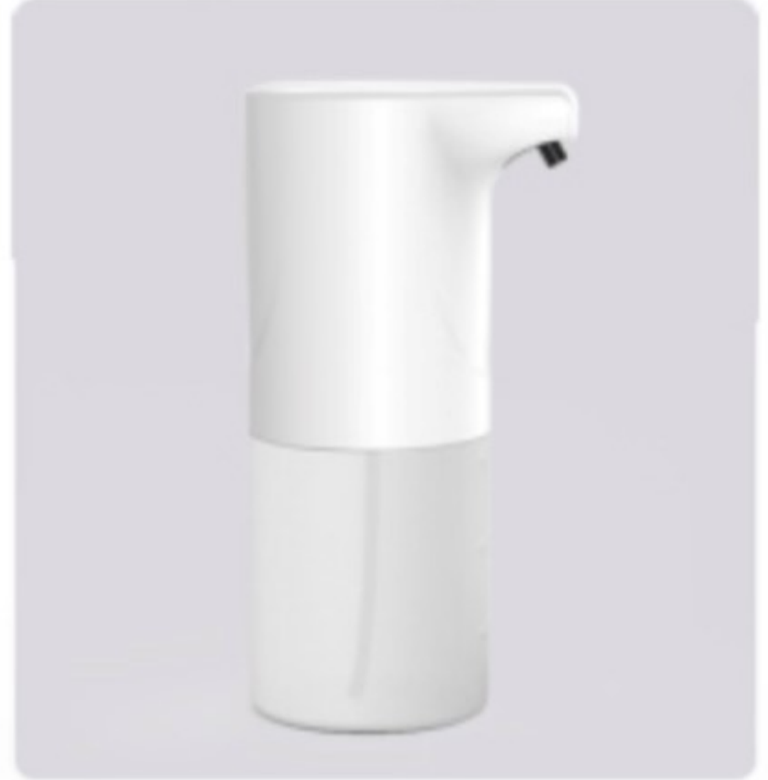
図4：完成したら直ぐに使用できます