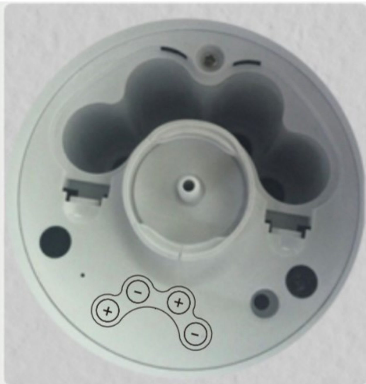
図2: 本体下部分の蓋を開け乾電池をセットします