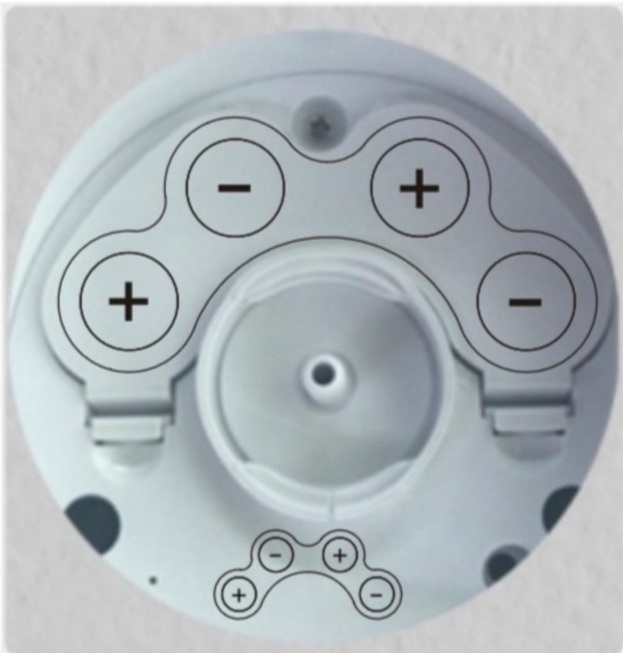
図1: 本体とボトルを分離します