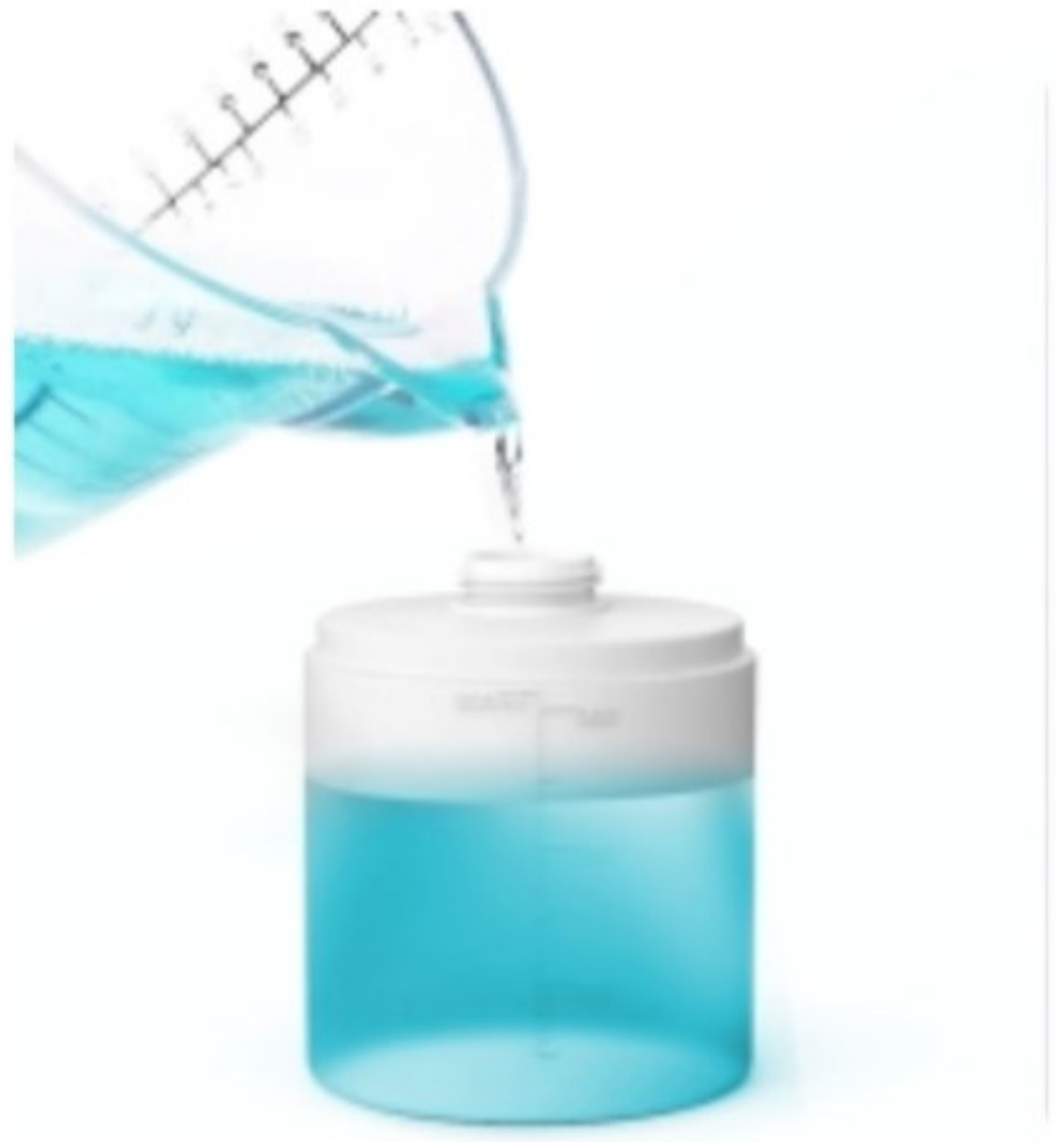
図2：ボトルにステリパワーを注入