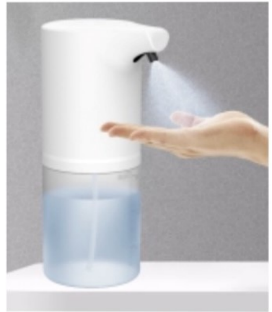
図2：手でセンサーを感知させる