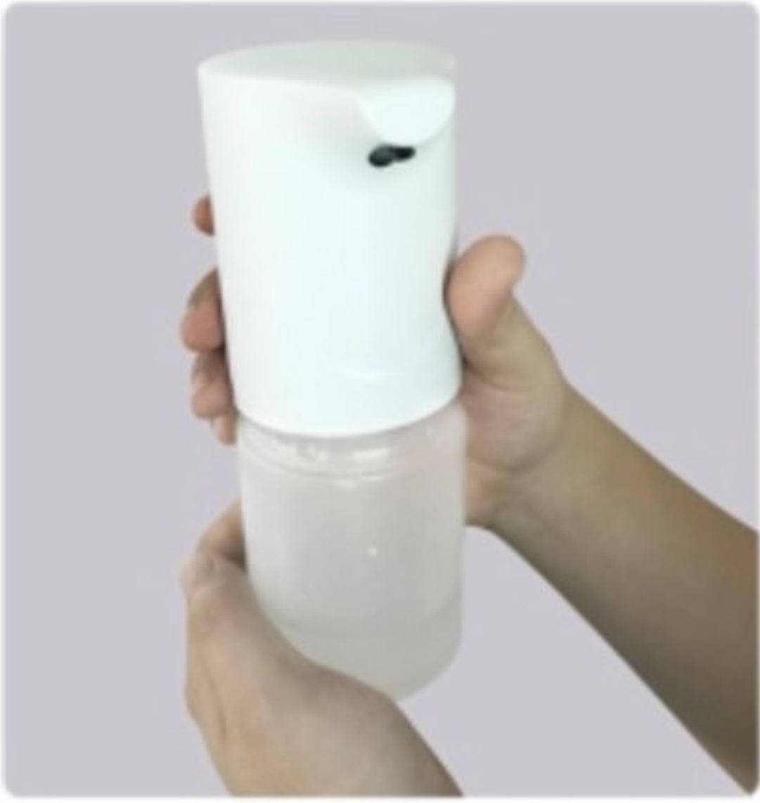
図1：本体とボトルを分離